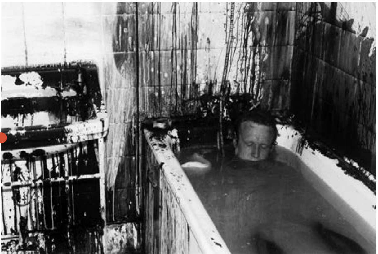
تصویر ۲: استوارت بریزلی (۱۹۳۳م). و برای امروز هیچ، ۱۹۷۲م، پرفورمنس، گالری دانشکده گوته، لندن.

به نهایت می‌رسد. آنها بعضاً با تکنیک‌های فیلمبرداری و تدوین تاثیرگذاری این صحنه‌ها را چندبرابر می‌کنند و حالتی بیمارگون و غیرقابل تحمل را پیاده می‌کنند (Schmatz، ۱۹۹۲: ۶۲-۶۱)، (Widrich، ۲۰۱۳: ۱۳۹-۱۳۸). آلفونس شیلینگ ۷۰ یک نقاش سوئیسی است و با اینکه به صورت مستقیم و رسمی در گروه کنش‌گران وین طبقه‌بندی نمی‌شود، یکی از اجراهایش بسیار شبیه به اجراهای آنها است. او در این اجرا یک گوسفند خون‌آلود را در برابر مردم به نمایش می‌گذارد در حالی که اعضای داخلی بدن گوسفند را روی ملحفه سفیدی قرار داده، سپس او لاشه گوسفند را از یک پا گرفته و در حالی که خون حیوان روی مردم پاشیده می‌شود، آن را روی سر جمعیت