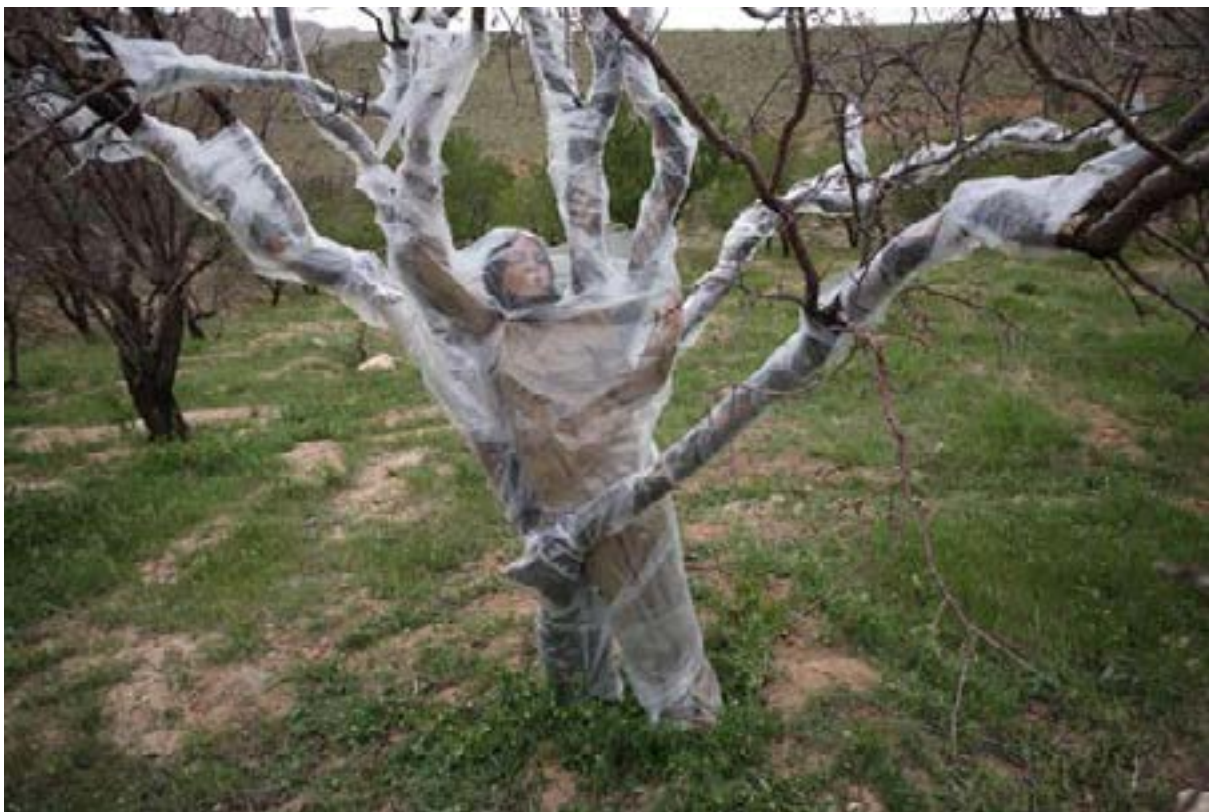
شکل ۲: فرشته عالم‌شاه، روح درخت.