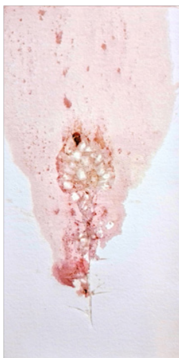
تصویر ۴، هیچا، بدون عنوان، (۱۴۰۱)، مونو پرینت، ۱۷*۳۳ سانتی‌متر.

در شرایط بحرانی جامعه، مسوولیت اجتماعی‌ای دارد که باید انجامش دهد. من به عنوان یک هنرمند با استفاده از هنرم سعی می‌کنم، تا گامی هر چند کوچک برای بهبود آینده مردمم بردارم.