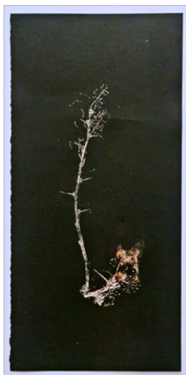
تصویر ۳، هیچا، بدون عنوان، (۱۴۰۱)، مونو پرینت، ۱۷*۳۳ سانتی‌متر.