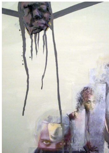
تصویر ۱: هورا میرشکاری، به من نگاه کن، ۲۰۱۰، ترکیب مواد روی بوم، ابعاد: ۷۰×۵۰، ایران.

بزرگی دست‌یافت. یکی از نقاشی‌های او با عنوان «به من نگاه کن» در سال ۲۰۱۱ برگزیده جشنواره «صدای زنان مسلمان» در کالیفرنیا شده است. (تصویر ۱)