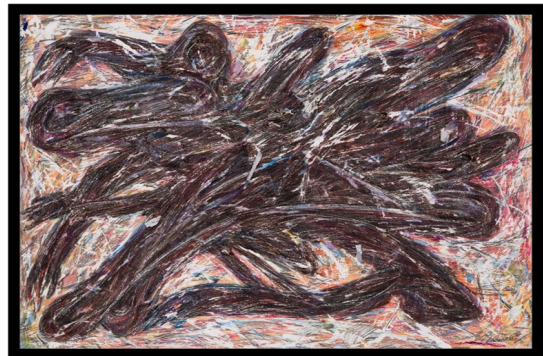
تصویر ۹-فرهاد گاوزن، بدون عنوان (۱۴۰۰)، مداد و آبرنگ روی کاغذ، ۵۰ * ۷۰ سانتی‌متر.