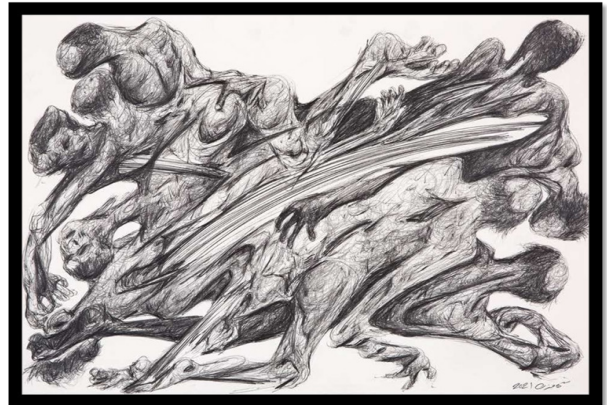
تصویر ۵-۵- فرهاد گاوزن، بدون عنوان (۱۴۰۰)، مداد روی کاغذ، ۵۰*۷۰ سانتی‌متر.

پیوستگی در هم بافته می‌شوند و فرم‌هایی مانند بدن انسان اما پویا و در حرکت ایجاد می‌کنند. این حرکت آزاد و پویا فرم‌هایی در حال استحاله ایجاد می‌کنند؛ گویا روح در مرحله‌ای پیش از جنگ، در حال سنجش تمامی امکانات خود است. فرم‌ها و اشکال مدام در