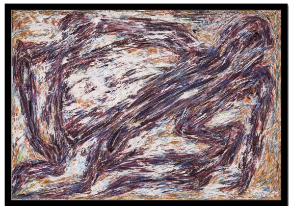
تصویر ۳- فرهاد گلوزن، بدون عنوان (۱۴۰۱)، مداد و آبرنگ روی کاغذ، ۷۶ * ۵۷ سانتی‌متر.

به قول رضا براهنی: «برای شاعر شدن تنها کلمه کافی نیست؛ تجربه دوزخ به اضافه کلمه یعنی شاعر»؛ برای دیدن دوزخی که گاوزن از آن عبور کرده نیازی نیست خیلی دور شویم کافی است کمی در مقابل یکی از آثارش بایستیم و از نزدیک به آن نگاه کنیم. در میان