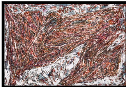
تصویر ۲ - فرهاد گاوزن، بدون عنوان (۱۴۰۱)، مداد و ابرنگ روی کاغذ، ۱۰۰*۷۰ سانتی‌متر

یک نقاش چگونه می‌تواند دردهای خود را به نقاشی بدل کند؟ این سؤالی است که تقریباً هر نقاشی، حداقل یک‌بار از خود پرسیده است. سؤالی که پاسخش، نه در