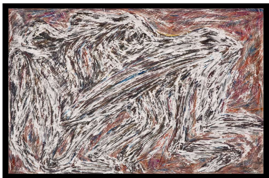
تصویر ۱۰-فرهاد گاوزن، بدون عنوان (۱۴۰۰)، مداد و آبرنگ روی کاغذ، ۵۷ * ۷۶ سانتی‌متر.