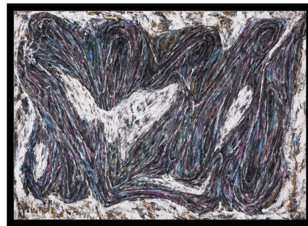
تصویر ۱ - فرهاد گاوزن، بدون عنوان (۱۴۰۱)، مداد و ابرنگ روی کاغذ، ۱۰۰*۱۵۰ سانتی‌متر

نتیجه بالفعل، بلکه در راهی است که برای رسیدن به پاسخ طی می‌شود. در اصل مسیر جاری شدنش، یعنی مسیر به فعلیت رسیدنش، معنای خود را می‌یابد؛ و نتیجه‌اش، هر چه می‌خواهد باشد، چه تابلویی نقاشی یا قطعه‌ای موسیقی، عریان جسدی است که در انتهای مسیر باقی خواهد ماند؛ اما همین عریان جسد تنها چیزی است که در نهایت از مسیر هنرمند به چنگ ما خواهد آمد. این تعبیری است که وقتی به نمایشگاه آثار نقاشی فرهاد گاوزن وارد می‌شویم با آن مواجه خواهیم شد. در نمایشگاه سه گروه اثر وجود دارد. بخش زیادی از تابلوها، آثار نقاشی هستند و بخش دوم که تعدادشان کم از گروه اول ندارد، طراحی‌هایی هستند سیاه و سفید که با مداد کار شده‌اند. اما گروه سوم آثاری مستطیلی و در قطع عمودی هستند که در وسط فضای گالری قرار دارد. هرچند آثار گروه سوم در سیر تحول هنری فرهاد گاوزن نقش به‌سزایی دارند؛ اما در این یادداشت به آن‌ها نخواهیم پرداخت و